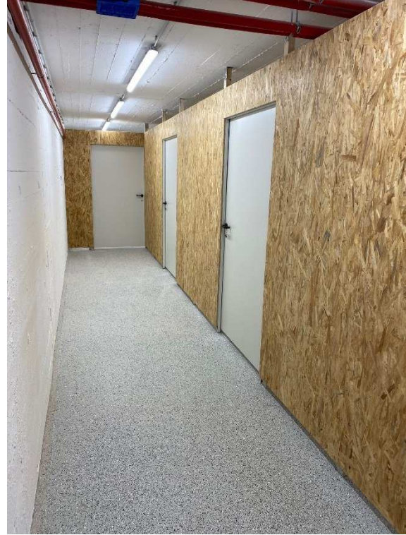
Lager / Lagerboxen KG