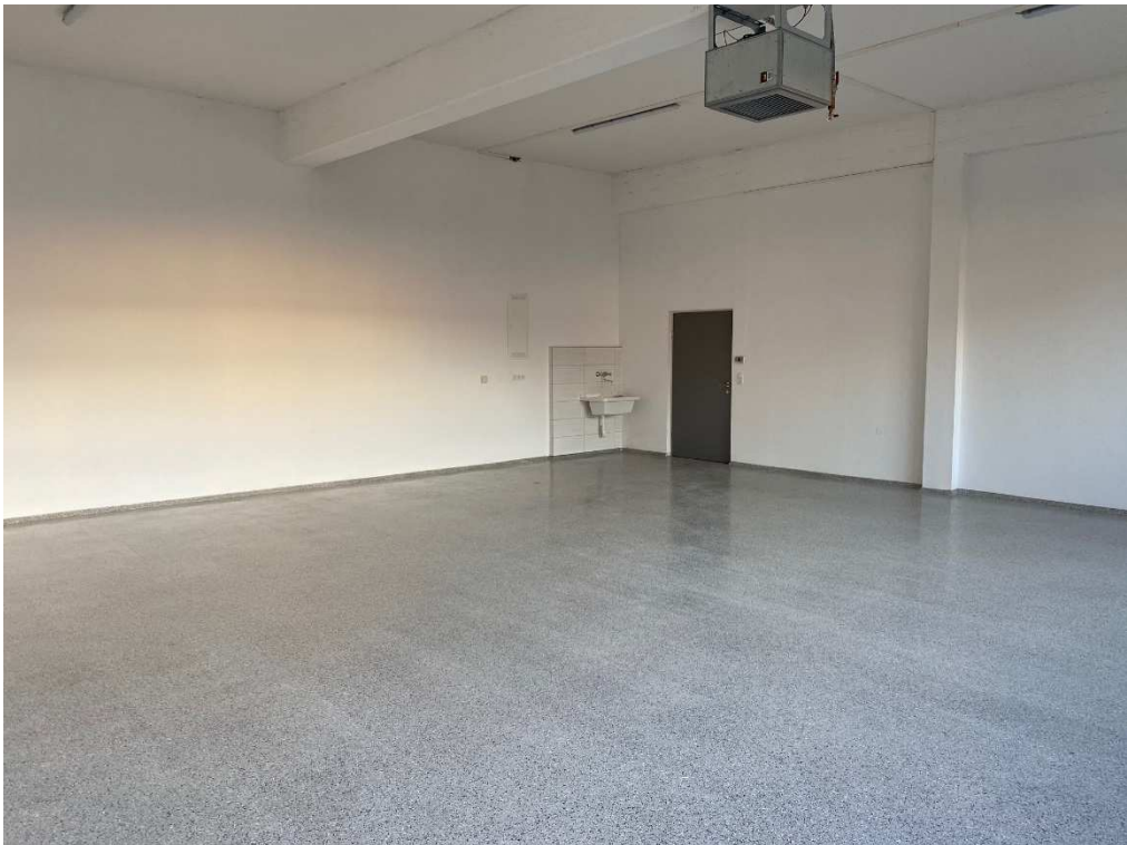
Werkstatt / Lager EG