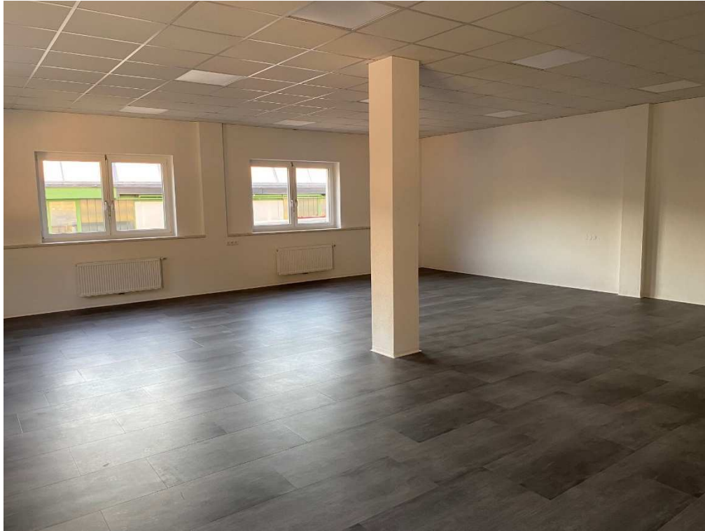
Geschäftsfläche / Büro / Lager EG