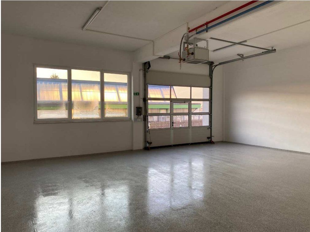
Werkstatt / Lager EG