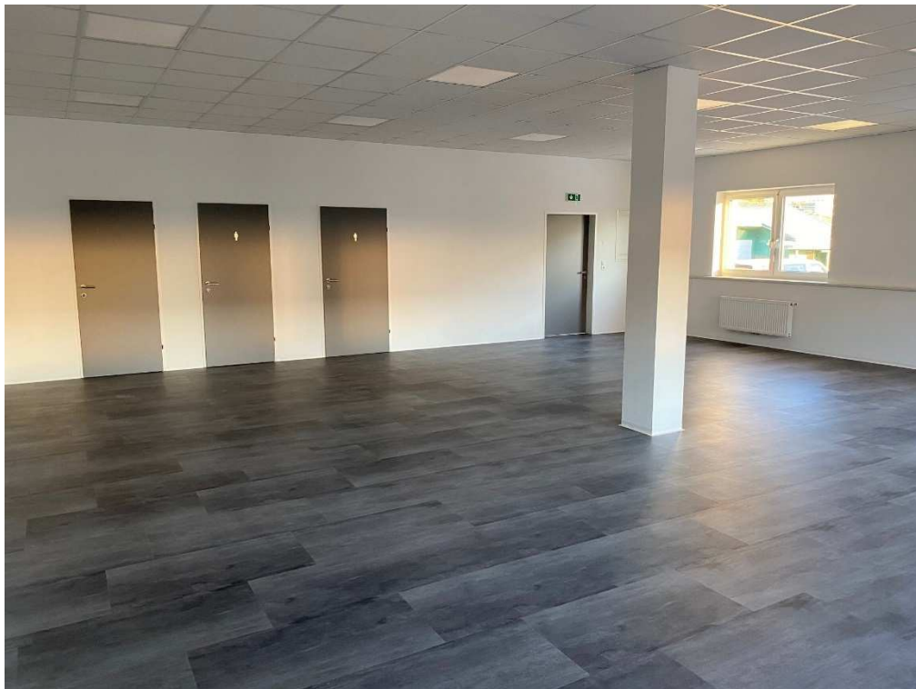
Geschäftsfläche / Büro / Lager EG